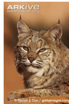
Rode lynx (Bobcat)

Je kon al lezen dat alle dieren een wetenschappelijke naam hebben die meestal uit twee woorden bestaat bijvoorbeeld Lynx lynx . Soms zie je daarachter nog een derde naam, bijvoorbeeld Lynx lynx kozlovi . Deze derde naam geeft de ondersoort van het dier aan.