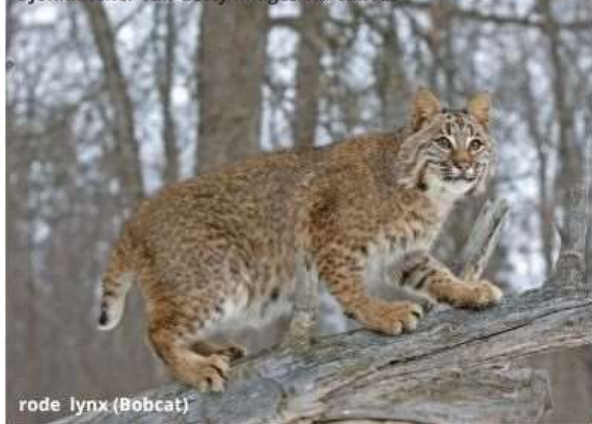
rode lynx (Bobcat)