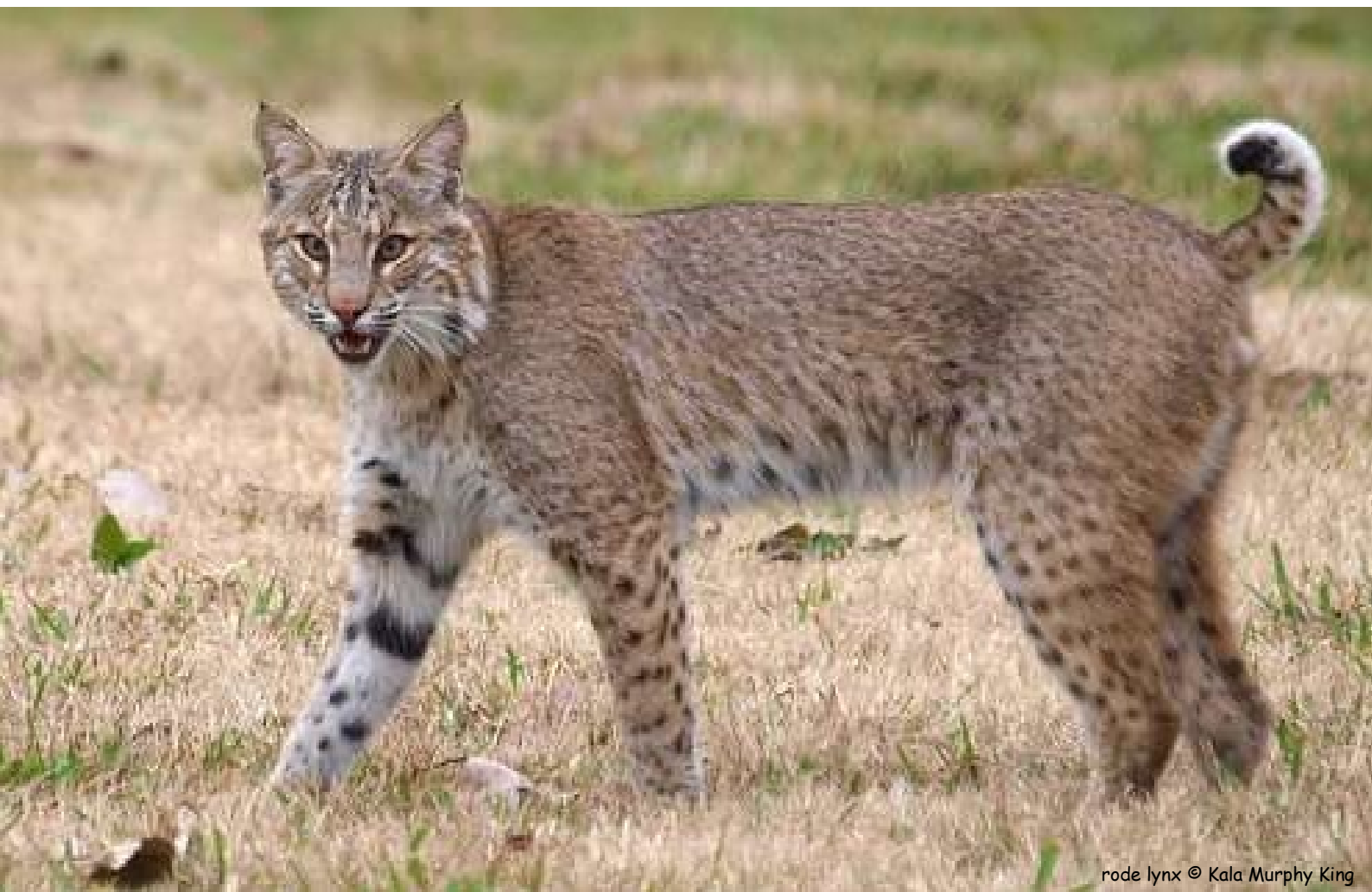
rode lynx

En het is natuurlijk ook gewoon verdrietig als zo'n mooi dier er straks niet meer is.