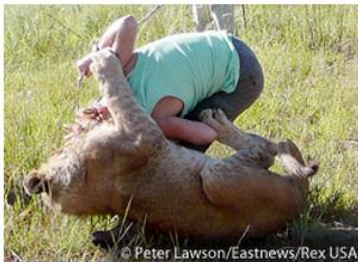
A tourist is attacked at a lion encounter operation in Zimbabwe. She made a full recovery.

Vervolgens wordt het welpje dagelijks door heel veel mensen geknuffeld. Wellicht heb je zelf katten? Katten, groot en klein, staan er niet echt om bekend echte knuffelaars te zijn. Soms willen ze wel geaaid worden maar ze bepalen zelf wanneer ze dat willen. Op een knuffelfarm wordt een welpje per dag wel door tientallen mensen opgetild en geknuffeld. Zou jij dat leuk vinden.....?