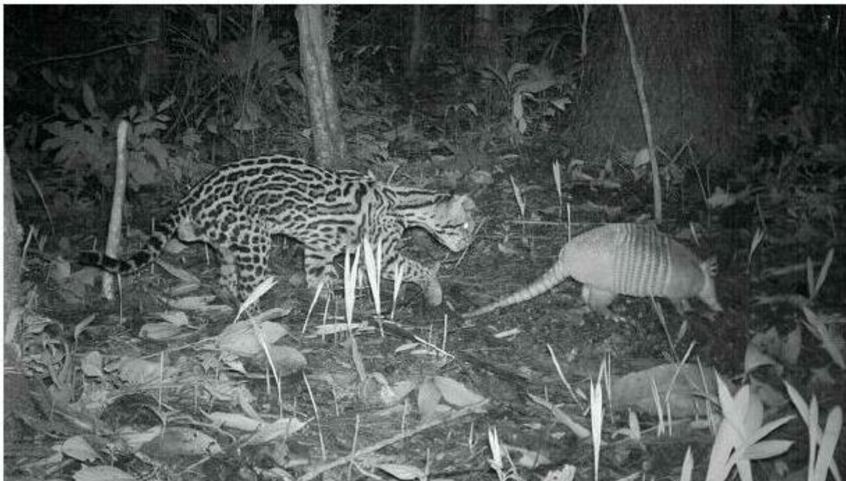
Op dit plaatje jaagt de ocelot op een gordeldier

De ocelot wordt zelf ook gegeten... door de jaguar!