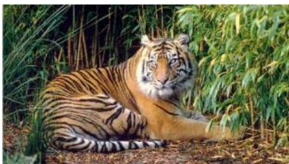
De Sumatraanse tijger