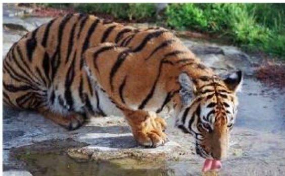
De Indochinese tijger