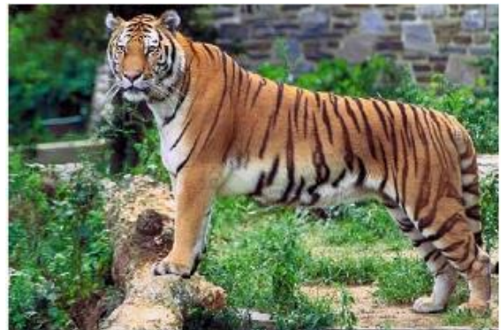
De Bengaalse tijger