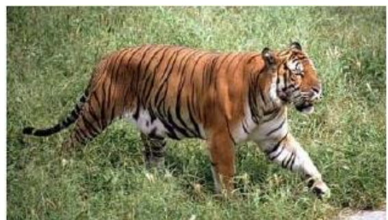
De Zuid-Chinese tijger