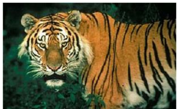
De Maleisische tijger