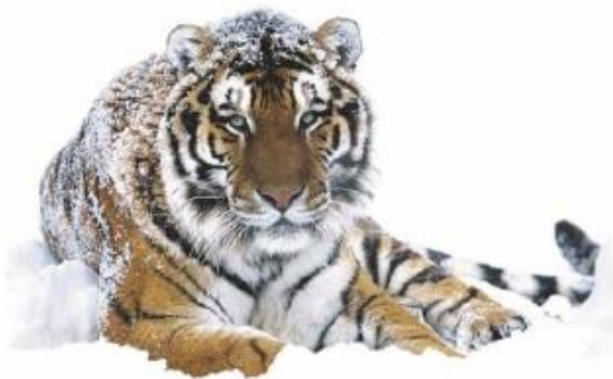
De Siberische tijger of Amoertijger

Een diersoort komt vaak voor in meerdere landen en streken voor. Die gebieden verschillen vaak heel veel van elkaar in landschap of temperatuur . Daarom verschillen de dieren soms in uiterlijk. Zo ontstaan ondersoorten . Ook bij de tijger is dit zo. De Siberische tijger is de bekendste. Er zijn 6 ondersoorten erkend door het IUCN (een belangrijke organisatie die helpt dieren te beschermen). Omdat er vaak veel discussie is om de diverse ondersoorten, benoemen wij deze niet verder in de spreekbeurten. Als je meer over ondersoorten wilt weten, kun je altijd kijken op onze website: https://stichtingspots.nl/onze-katten/alle-katachtigen/sneeuwpanter/