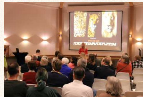
We vierden ons jubileum bij Dierenpark Amersfoort, ARTIS en Safaripark Beekse Bergen. Al jarenlang trouwe partners van SPOTS.